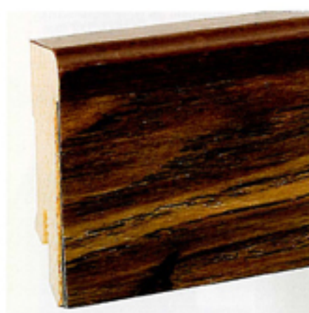
Ein Steckfussleistensystem mit entsprechenden Einklebestreifen, die jeweils identisch mit dem Dekor des Bodenbelages sind, ist für alle Designervinyl-Kollektionen erhältlich.

Bei diesem System werden die Sockelleisten, die es in den Farbtönen Weiss, Schwarz, Dunkelbraun, Rotbraun, Eiche, Buche und Ahorn gibt, zuerst an die Wand geschossen oder gedübelt und anschliessend die Dekor-Einklebestreifen